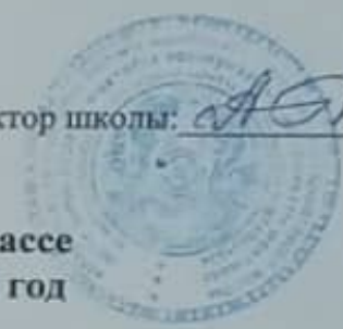
ГРАФИК Проведения государственных экзаменов в 11 классе по Каратаусайской ОСШ за 2022-2023 учебный год